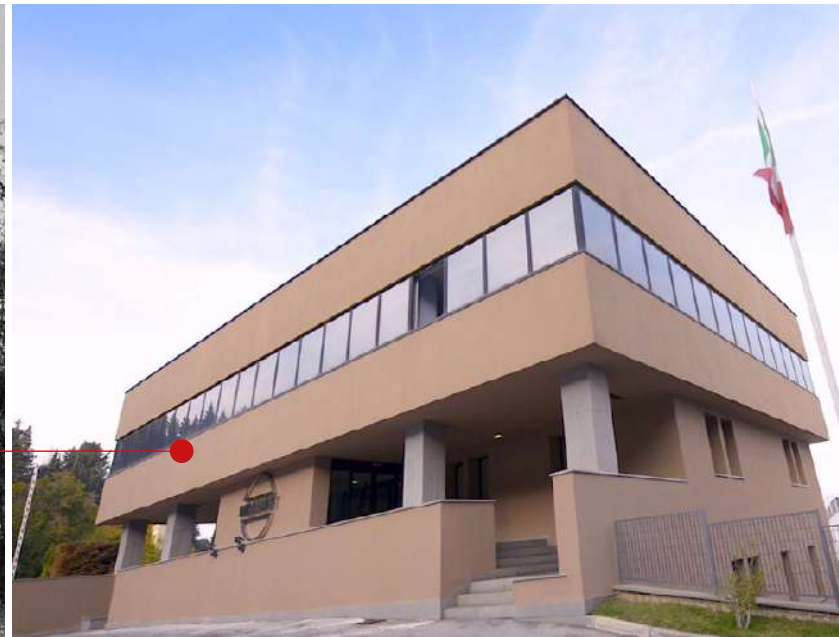
Above-1974: Establishment of the HQ in Arcevia, in the Italian household appliance district On the right: Entrance of Arcevia plant